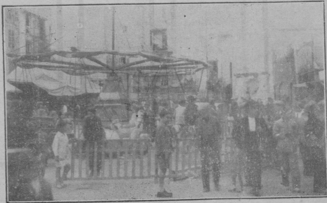
El solar de la Casa de Correos, convertido en diversión de caballos y barracas de feria