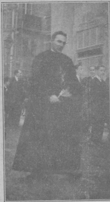
Elocuente orador, cuyo celo apostólico ha dado ahora en Palma fructuosos resultados con sus recientes ejercicios en las Reparadoras y en San Felipe Neri

pero esto sucedió sólo en muy limitadas zonas. La atmósfera estuvo generalmente excitadísima. Prosiguió la tempestad por todo el Mediterráneo. Y el otro avión que a la par que el nuestro habría de llegar, fue lanzado al agua.