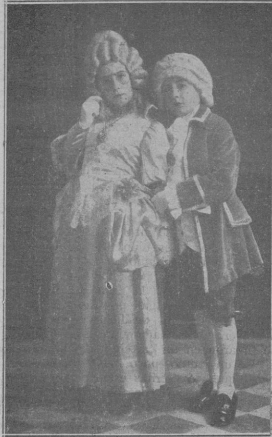
Mascaritas de este Carnaval.—Fotografías facilitadas por el notable fotógrafo Sr. Rullán