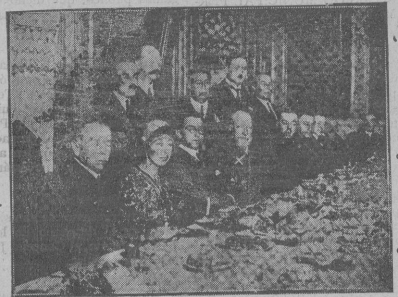
El Rey Fernando de Bulgaria, en el thé con que fué obsequiado por las autoridades de Vigo

Unas volutas de humo, que se pierden entre el terreno, sin fuerza para elevarse, y detrás arrastrándose lento un negro gusano. ¡El tren! ¿Y ese es el monstruo devorador de distancias?... Muy equivocadamente lo cantó Campoamor.