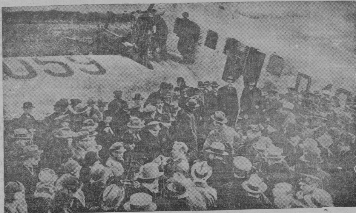
Las autoridades e invitados alrededor del aparato poco antes de salir de Barcelona para Berlín

Los sabanones se curan con los Lápicos «MABUTI»