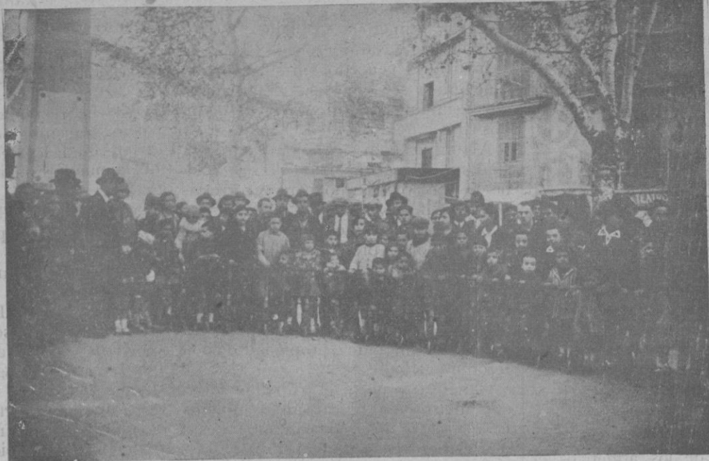
Los niños que fueron obsequiados con patinettes en el Paseo del Borne, por la casa «Nelia»