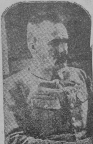
Pilsudski, el jefe del gobierno polaco, cuya figura atrae la atención del mundo por el conflicto entre Polonia y Lituania.