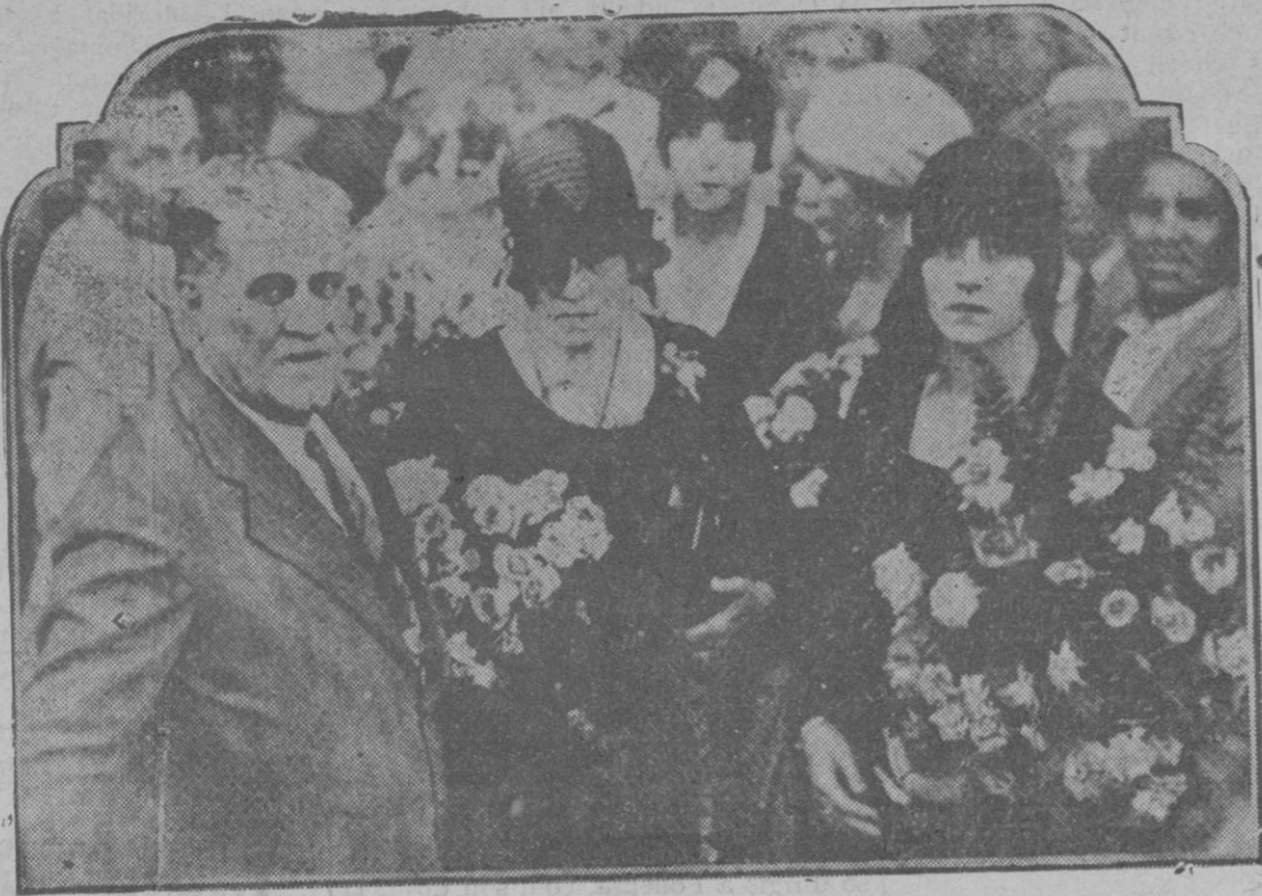
Uno de estos días llegará a Palma nuestro ilustre paisano D. Antonio R. Barceló, Presidente del Senado de Puerto Rico, que viene a Mallorca a descansar de su vibrante vida política.