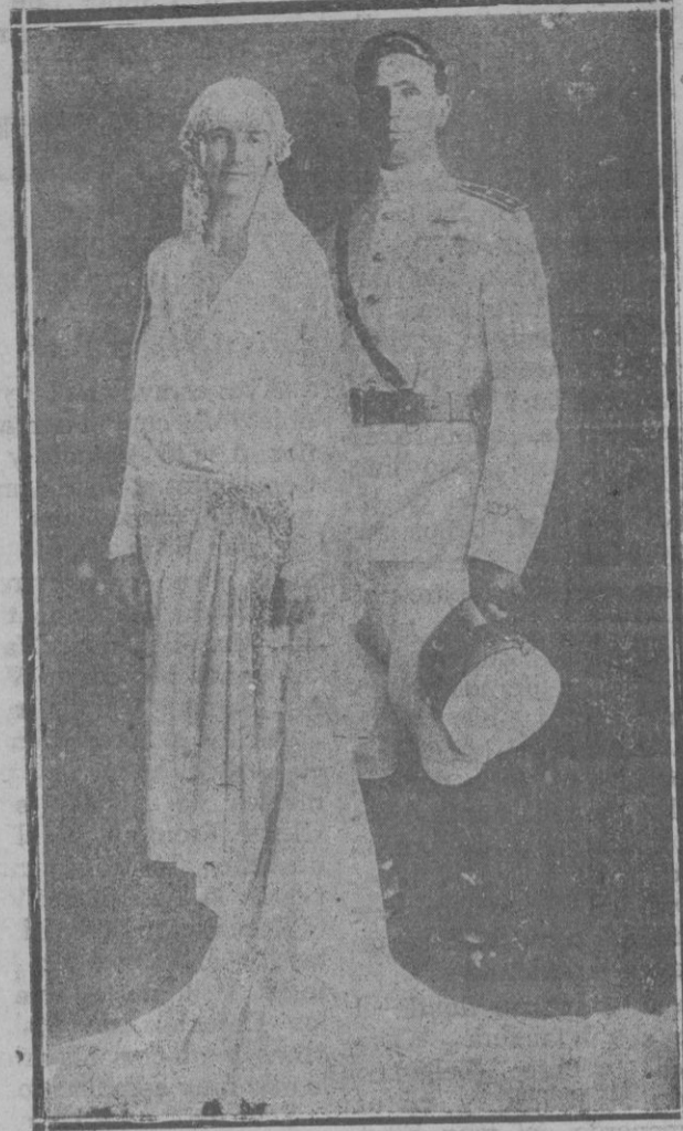
El duque de Puglia y la princesa Ana de Orleans, cuya boda apadrinó el Rey de España D. Alfonso

rencia, de Nápoles o de Roma, es perder el tiempo. Nadie se ha de molestar en leer tales artículos ni nadie ha de gastarse unas pesetas en adquirir esos libros.