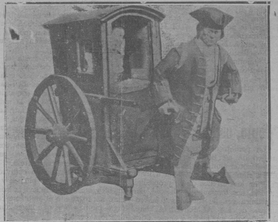
Silla de mano que figura en la exposición de vehículos que se celebra en París.—Así viajaban por las calles de París en 1770

voca este insensato afán de poseer un automóvil! ¡Cuántas desgracias! Y la mayor, a mi entender, es el matrimonio sin amor. En el romántico y desinteresado siglo pasado y hasta en los comienzos del presente, el hombre y la mujer soñaban con un hogar, procuraban, pues, buscar el compañero. La sociedad conyugal era un lazo que unía dulcemente a dos seres que se amaban. Hoy es algo muy distinto. El hogar es secundario, apenas se vive en él, se sueña con el automóvil, y el que no lo tiene, busca al que puede proporcionarlo. La sociedad conyugal es ahora un la-