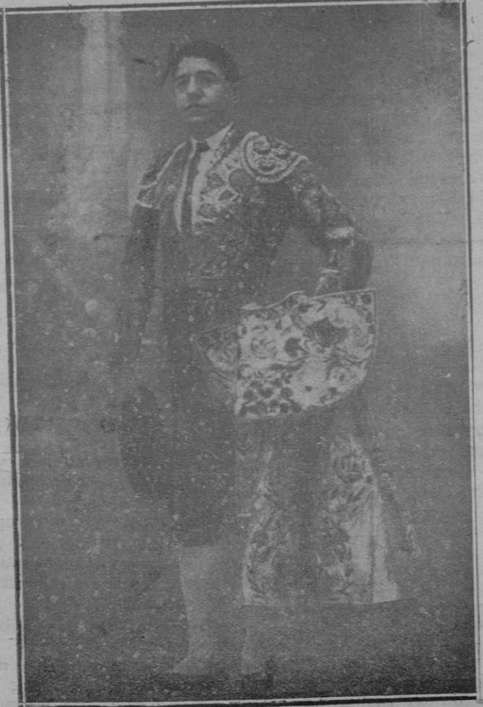
El famoso diestro Luis Freg, que se ha prestado generosamente a tomar parte en el festival de esta tarde