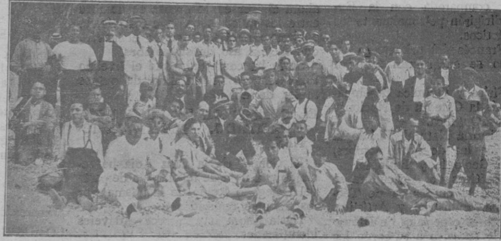
Grupo de excursionistas en el Torrent de Pareys