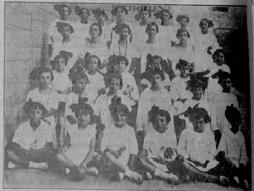
La colonia escolar de niñas del Ter eno patrocinada por el Excmo. Ayuntamiento

2.º Carrera local, para corredores de la localidad (10 vueltas). Premios: 15, 10 y 5 pesetas.