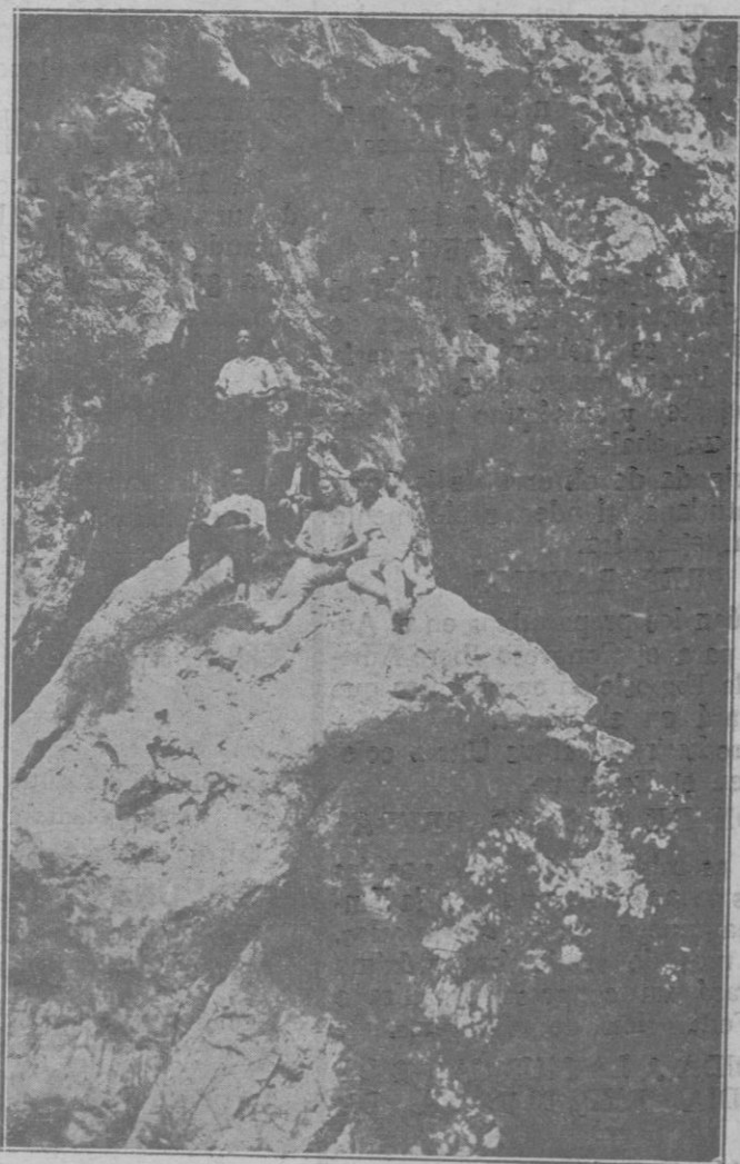
Un grupo de excursionistas en lo más abrupto del Torrente