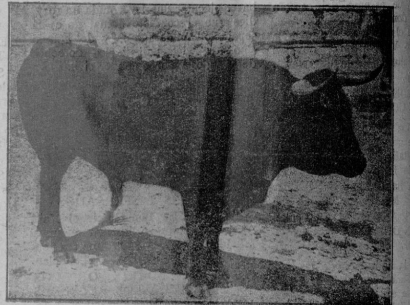
«Pinta Estrella», núm. 156, negro entrepelado