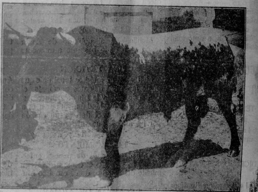
«Ronquillero», núm. 210, cárdeno claro, ensabonao