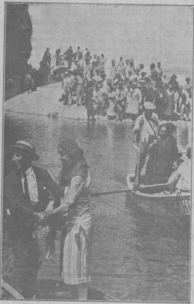
Los excursionistas pasando la laguna que hay cerca de la desembocadura del torrente