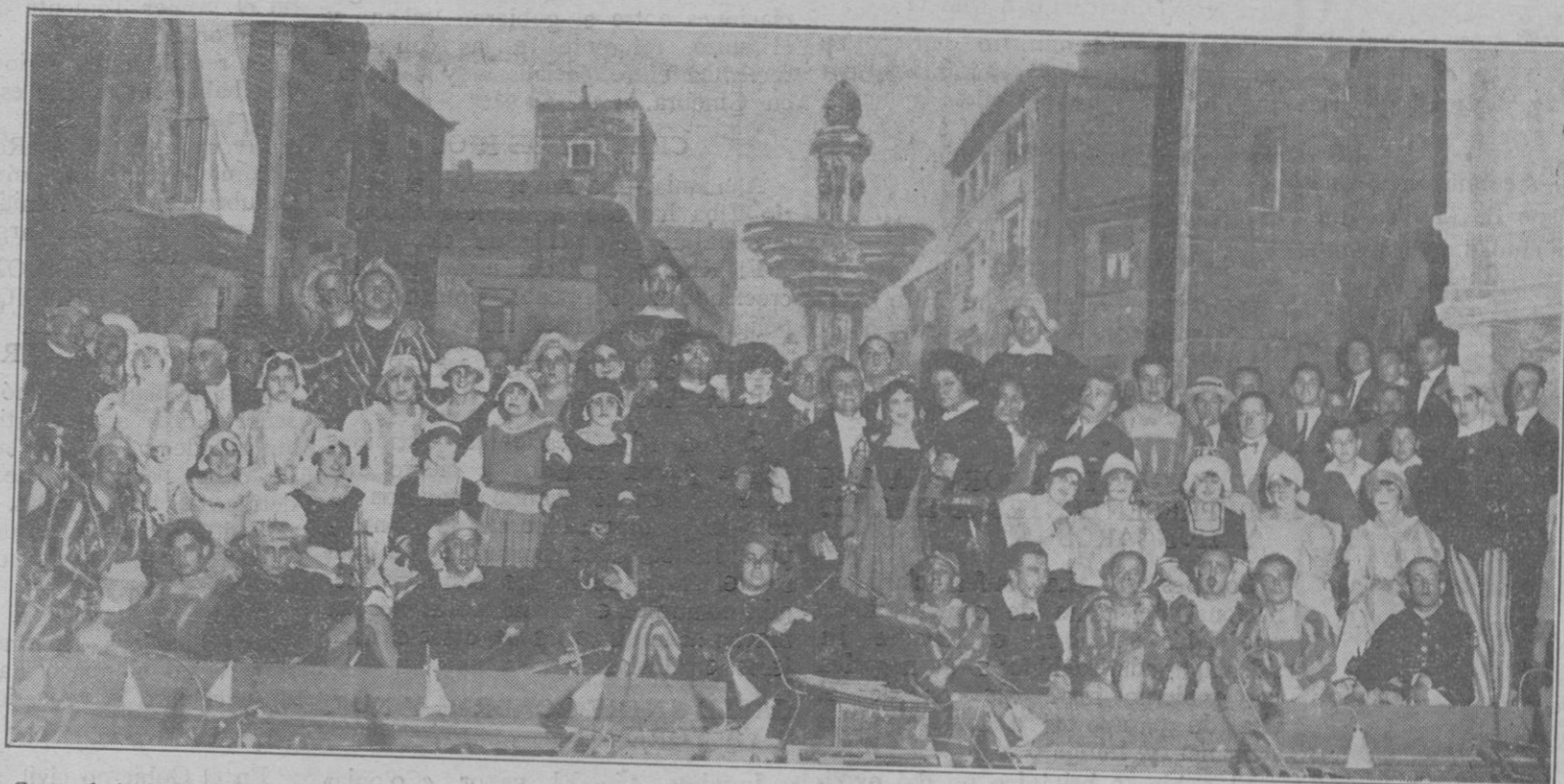
Grupo de intérpretes de la ópera «Faust», que desempeñada por distinguidos aficionados se ha representado por tres veces con grandioso éxito en las tablas del Teatro Principal de Palma

contrapeso a su balanza, ha tenido la feliz ocurrencia de «adornarla» con una rosa espléndida rellena de plomo en su capullo.