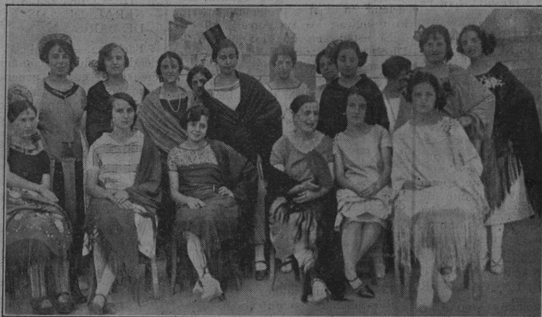
Grupo de distinguidas señoritas que asistieron a la verbena celebrada en el Corp Marí por la pujante Sociedad «Belver».