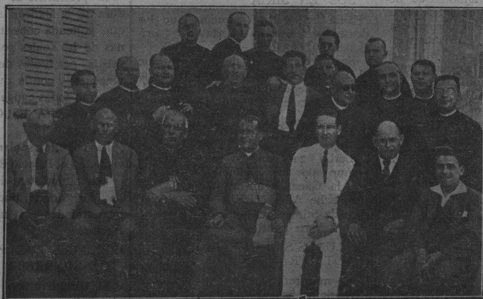
El Ilmo. Obispo Dr. Juan Sastre, rodeado de los sacerdotes naturales de Santa Eugenia de las autoridades y del diputado provincial señor Aguiló, el día del solemne recibimiento que el pueblo natal dispensó al Obispo de San Pedro Sula.