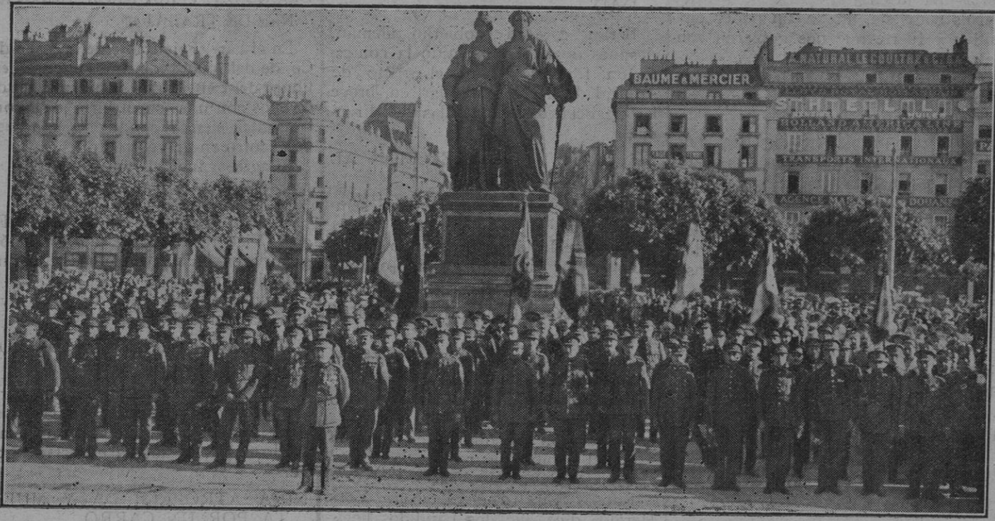
La famosa banda de los «Guides» de Bruselas que pasa a Palma para tomar parte en las Ferias y Fiestas