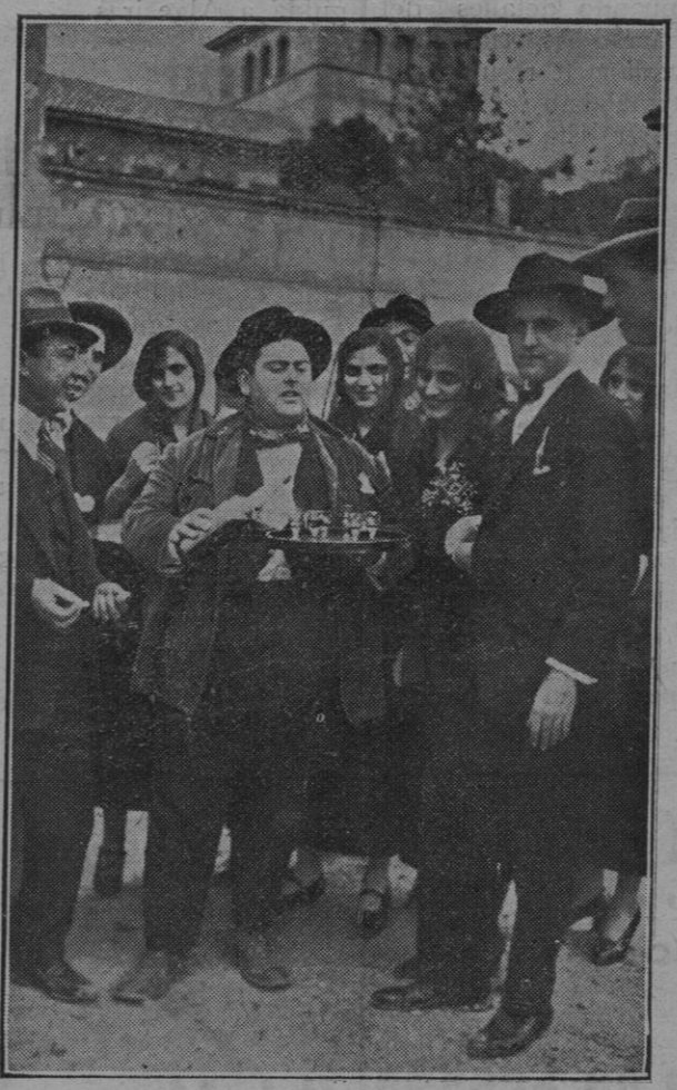
El refresco después de la boda en la iglesia pueblerina