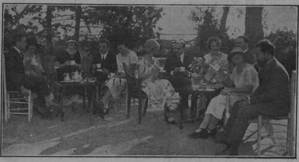
El té, en la terraza del magnífico edificio Son Veri