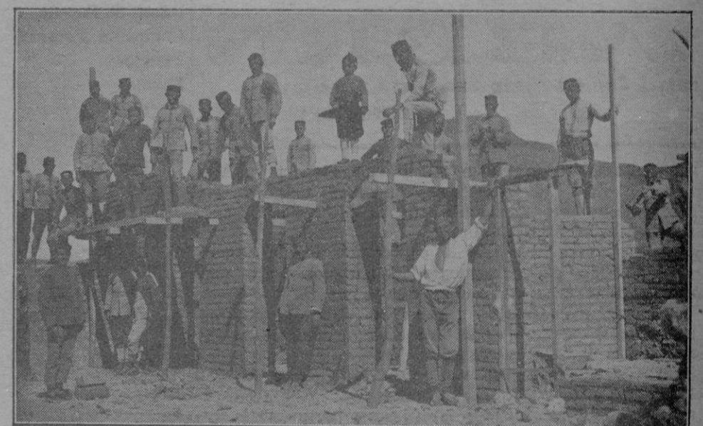
Barracón en construcción por parte de los soldados