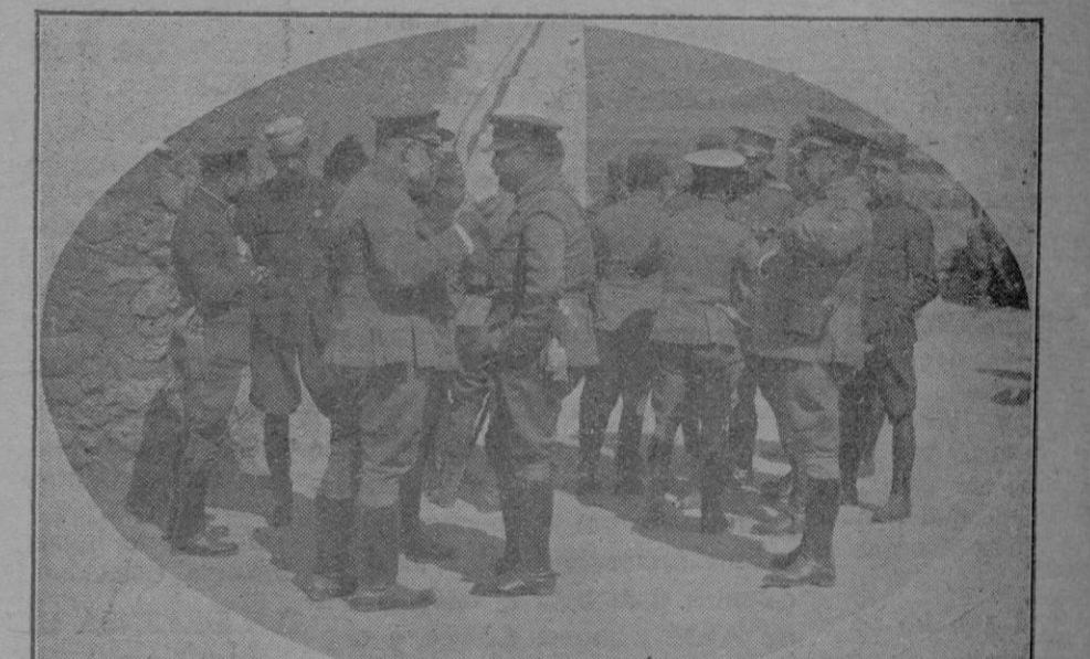
Recuerdo de la visita hecha al campamento por el general Navarro, Este hablando con el jefe de la columna