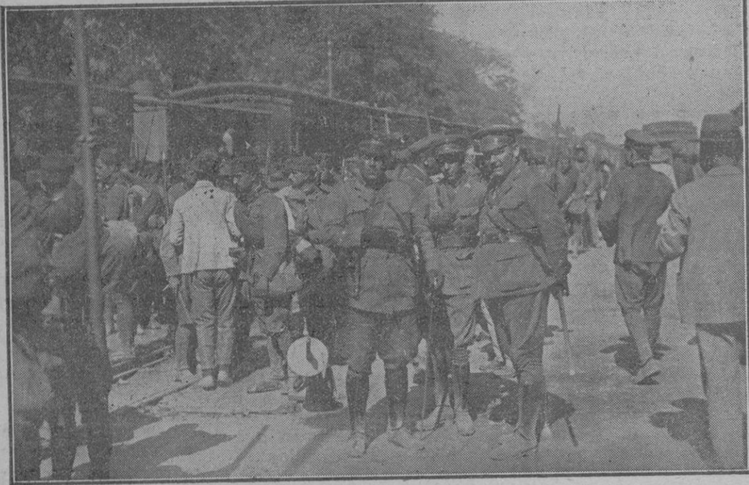
Momento de desembarcar el batallón en la estación de Palma

quido, en dicho ejercicio, de 8 mil 396'60 pesetas.