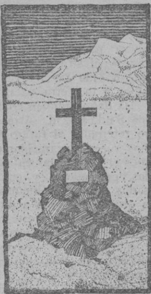
La tumba de Shackleton