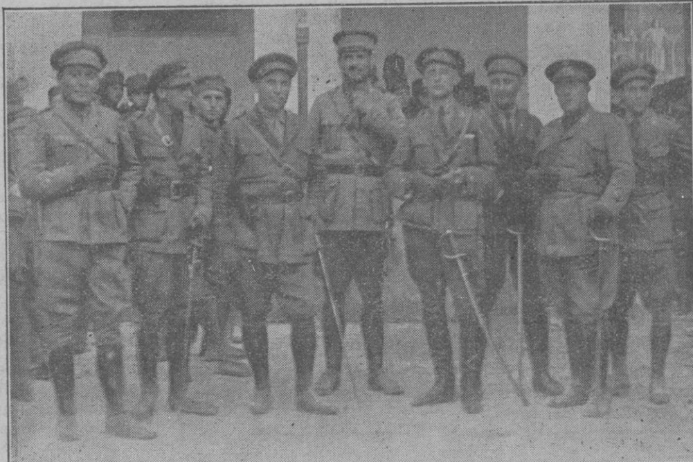
La plana mayor del Batallón

El sábado próximo pasado se constituyó en la Delegación de Hacienda de esta provincia la Junta liquidadora de los débitos que tienen pendientes los Ayuntamientos con la Diputación Provincial, con sujeción a las disposiciones vigentes.