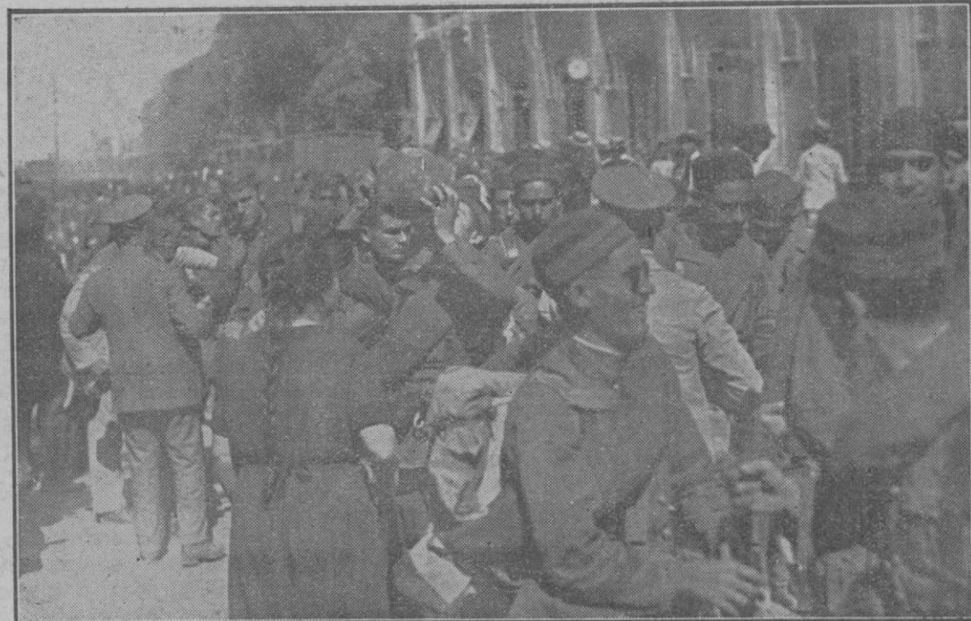
Al salir de la estación de Palma