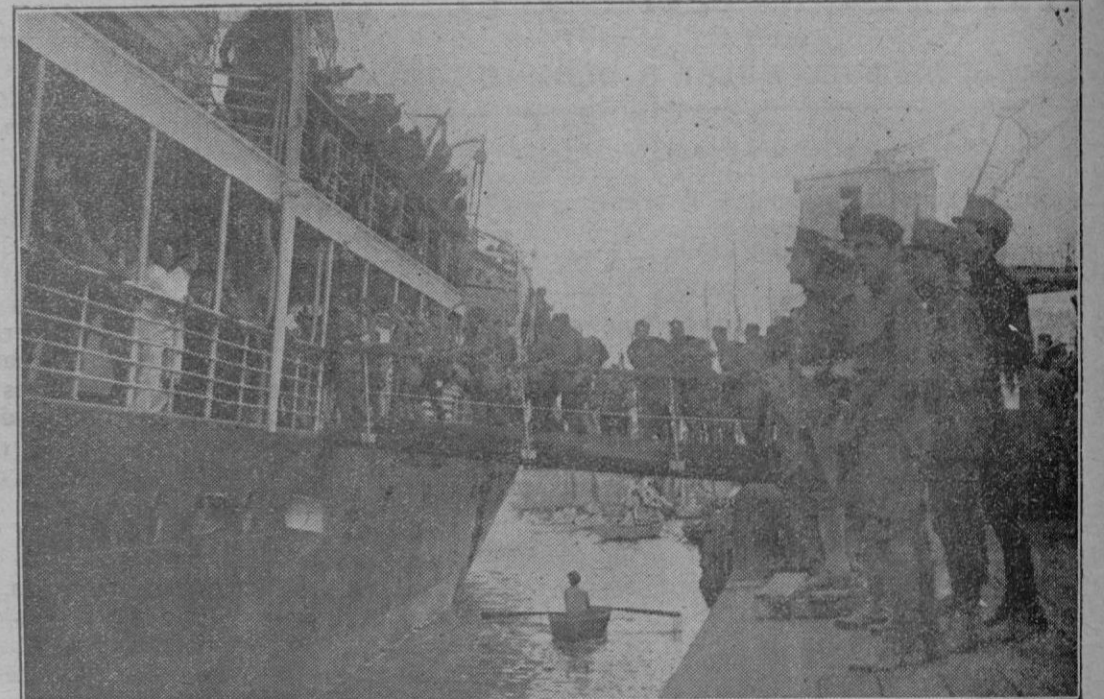
Embarcando a bordo del vapor «Rey Jaime I»

quidar los débitos de los Ayuntamientos.