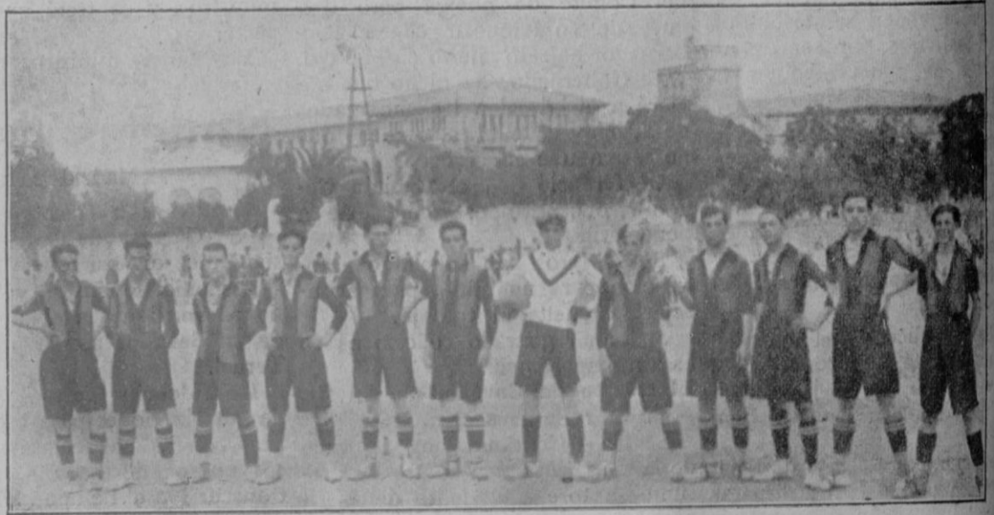
El equipo «Regional» en su nuevo campo situado cerca del Velódromo de Tirador, al lado de los edificios Escuela de Comercio e Instituto