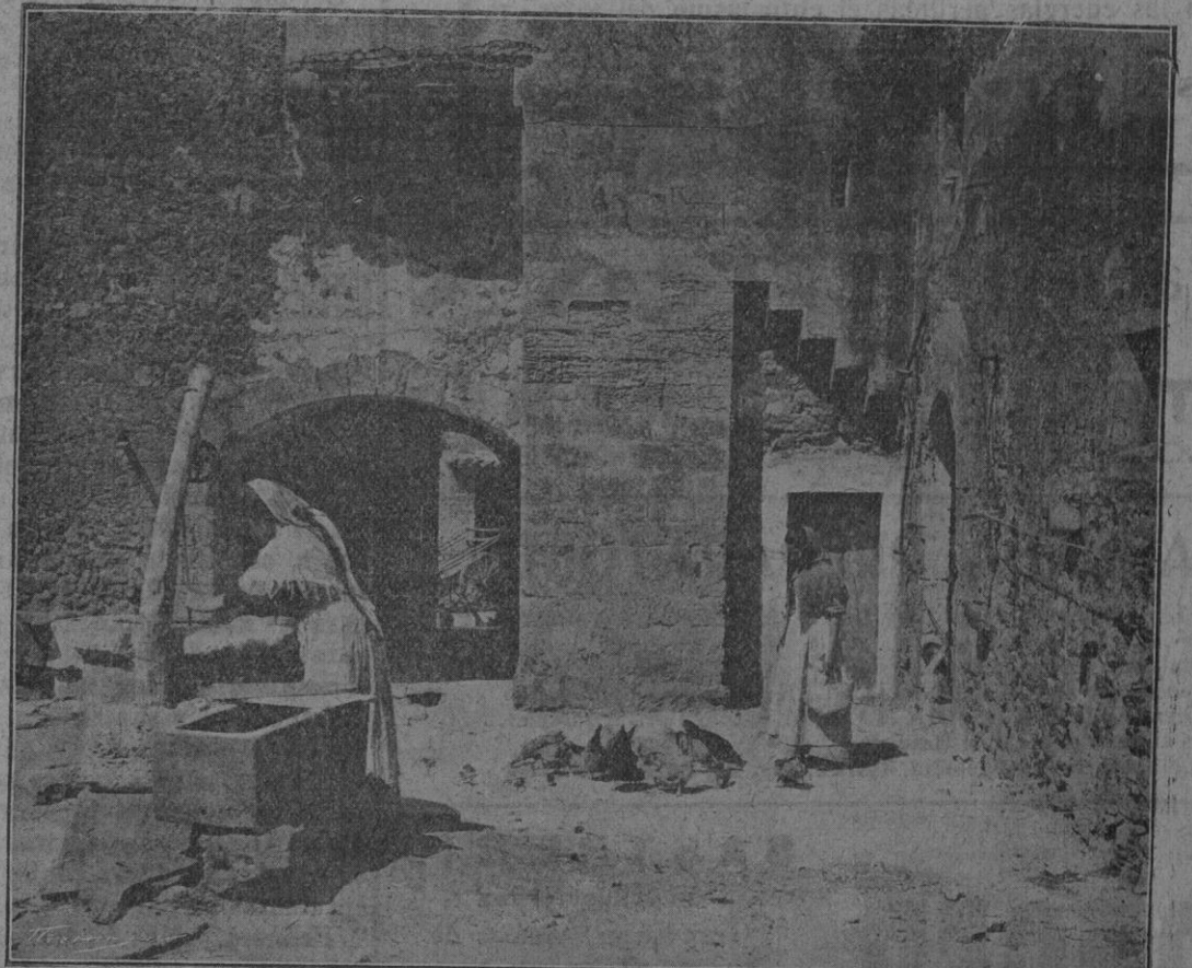
Típico patio Mallorquin de la finca «Es Rafal» de Manacor