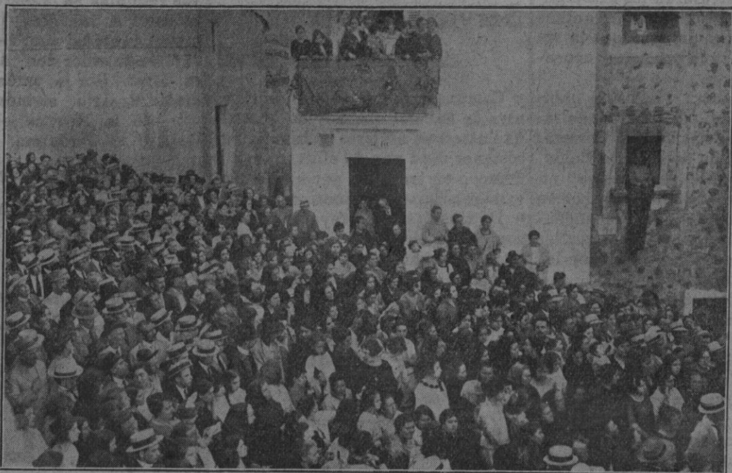
Plaza de la Constitución, de Andraitx, durante el mitin celebrado el domingo 17 del actual por la Liga espiritual contra la Blasfemia, con asistencia de las autoridades y numeroso público.