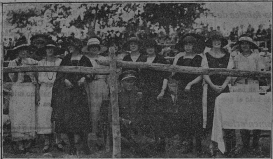
Señoritas que tomaron parte en la interesante prueba «Kinkhama».