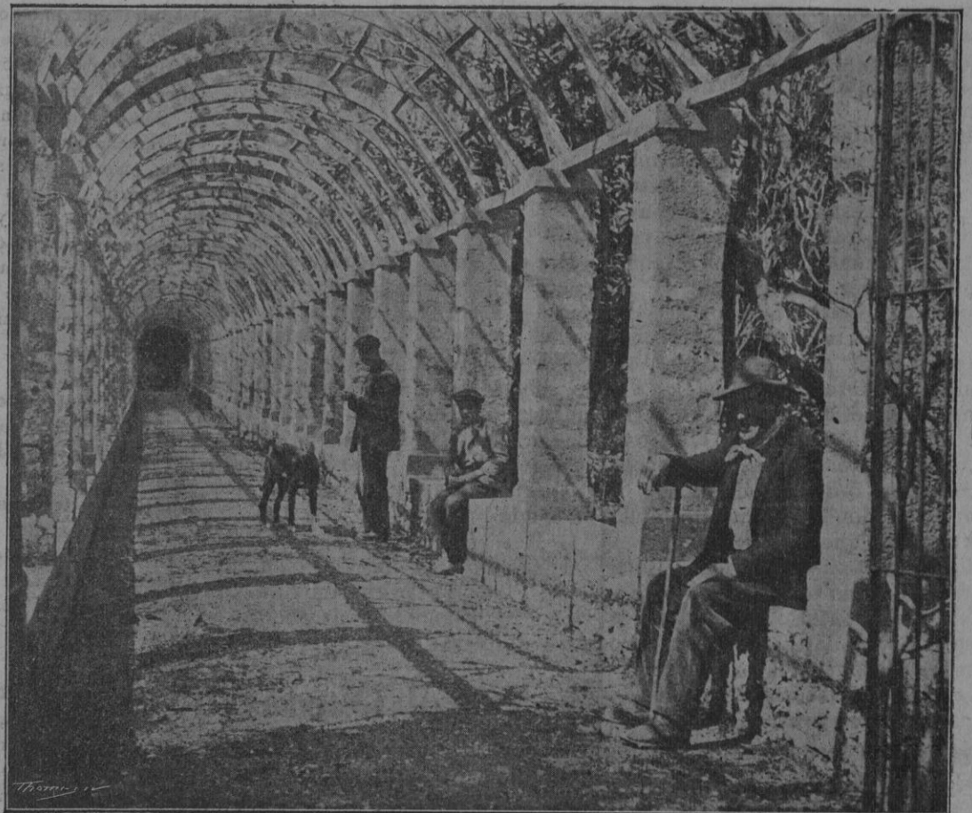
PUIGPUNYENT.—Parral de Son Forteza