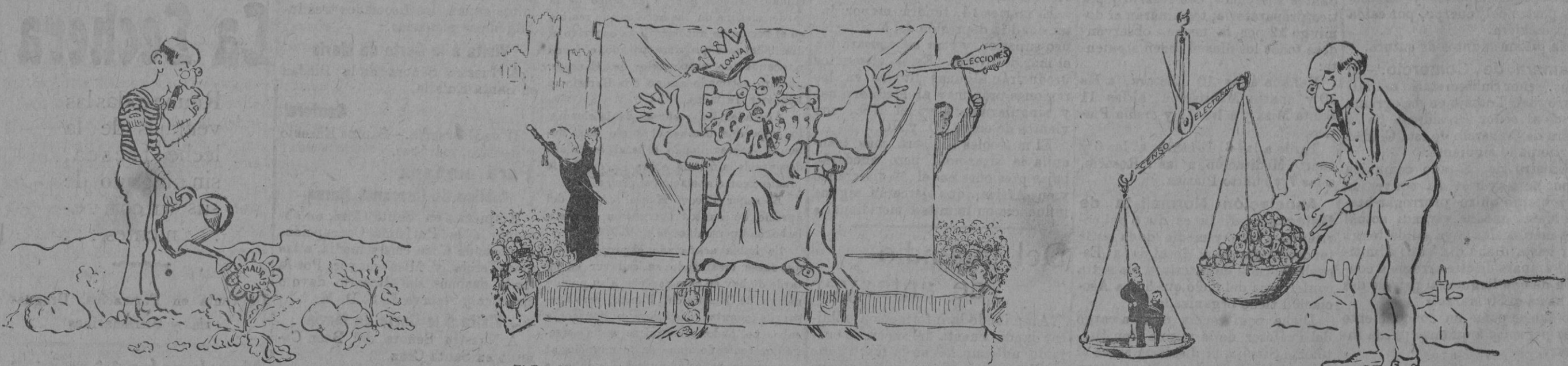
El hortelano: No siempre las flores son de la semilla sembrada.

De la revista «Baleares».- Original de Pedro J. Barceló