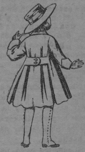
N.º 104.—Abrigos de patén para niñas de 4 á 8 años. De ptas. 15 á 17.