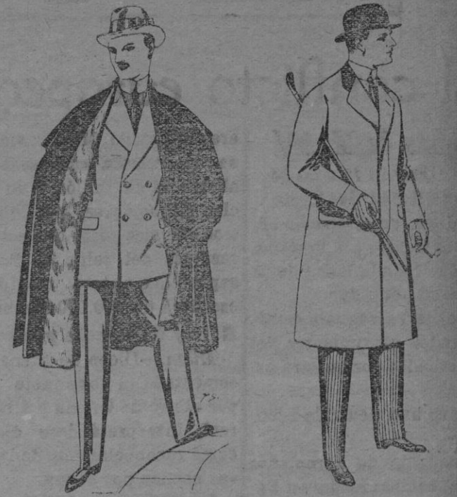
N.º 9.—Capas (enteras) de paños de Béjar y Tarraza, embozos de peluche, terciopelo, astrakán ó escocés. De ptas. 35 á 115. N.º 4.—G. banes de patén, melton y cheviot, con forros, seda, satén ó escocés. De ptas. 33 á 100. Los mismos á medida. De ptas. 75 á 180.