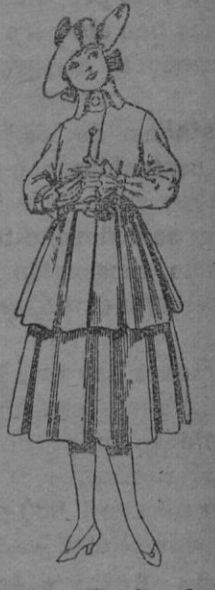
N.º 97.—Trajes de lana, para jovencitas de 12 á 15 años. De ptas. 45 á 55.

Gorras, Sombreros, Cinturones, Calcetines, Corbatas, Fajas, Ligas, Tirantes, Leggings, etc.