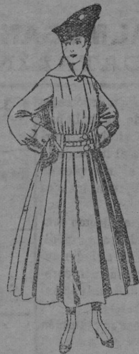
N.º 50.—Abrigos de patén, en color, para señora. De ptas. 50 á 60.