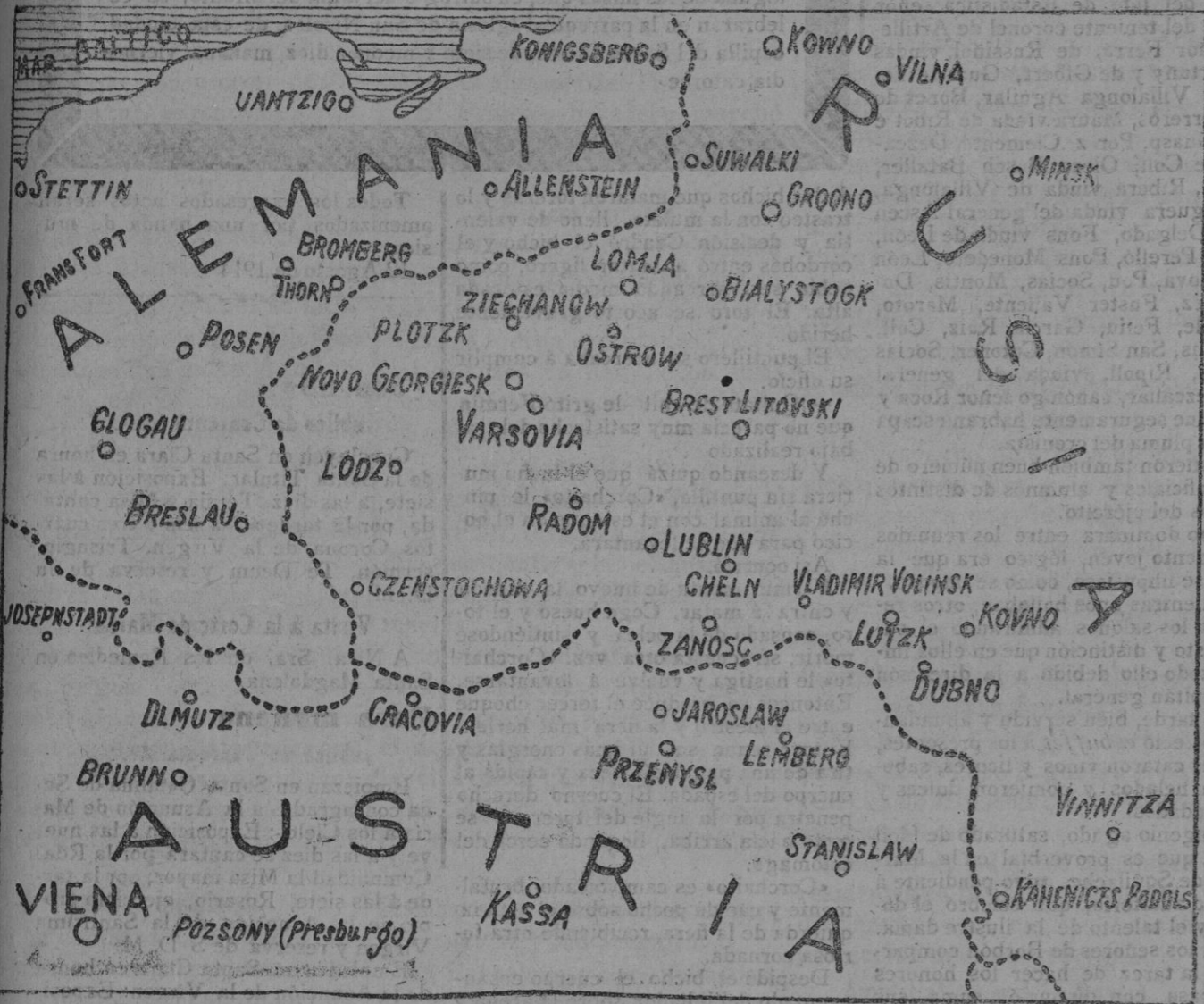
La frontera de Rusia con Austria y Alemania, donde se desarrolla una fase importante del conflicto europeo