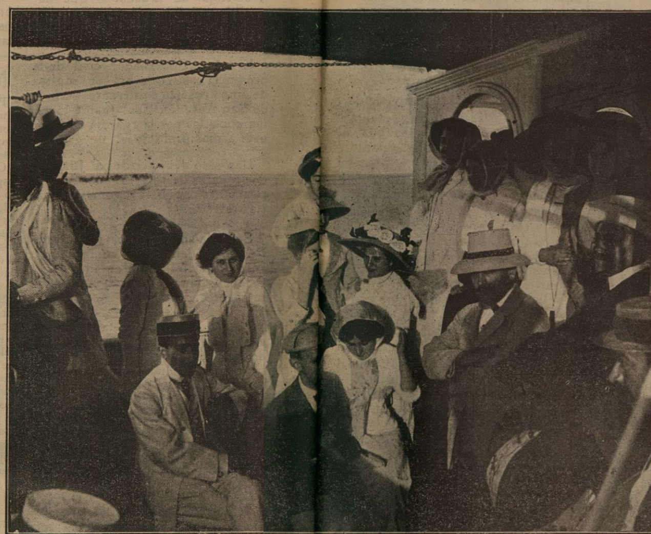
Un rincón céntrico. En el fondo se ve el Balear