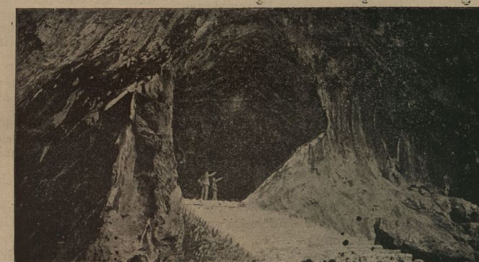
Entrada á las cuevas de Artá