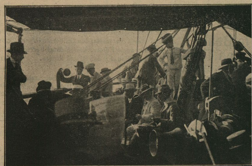
Grupo de excursionistas en la proa del Balear