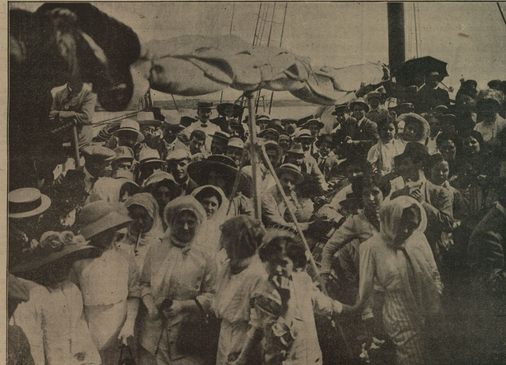
Grupo de excursionistas en la toldilla del Lulio