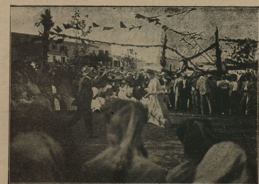
En el puerto de Manacor.—Balle al estilo del país, en obsequio de los excursionistas de LA ALMUDAINA