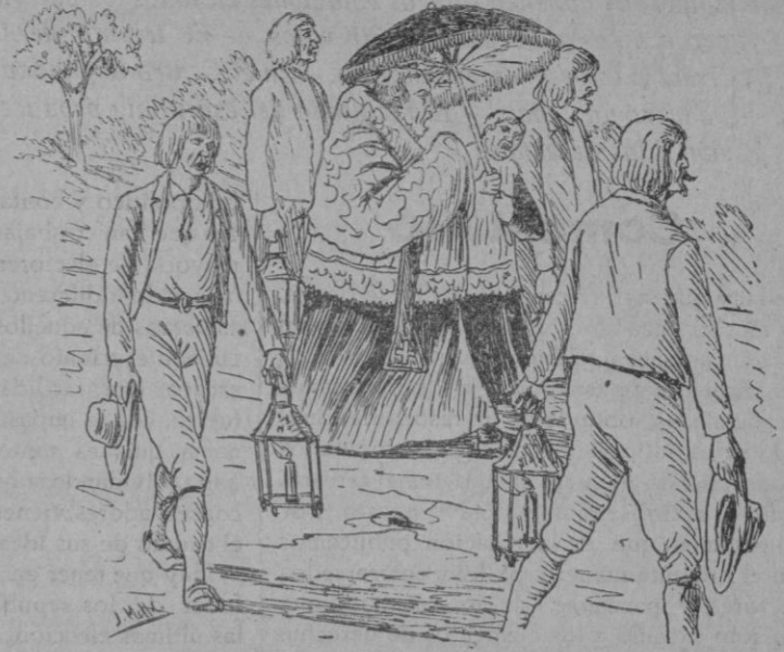
Ets estudiants al punt tornaren ab so combregar