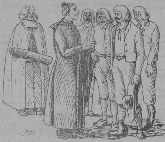
Aquest mesquinet está molt al baix

d'aquell mesquinet, desde ses espalles fins a sa renyonada y ses anques.