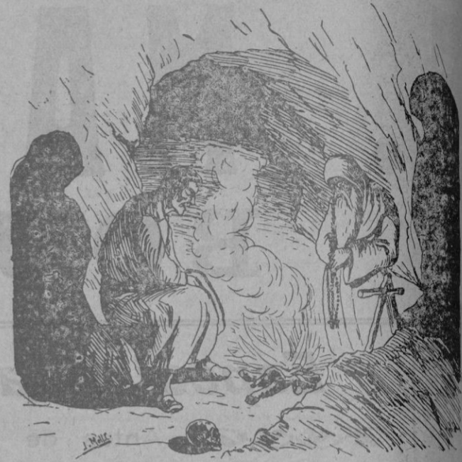
Ab s'ermitanet passen es Psaltiri

En Juanet romàn an aquella ermita. Ab s'ermitanet passen es Psaltiri y un bon enfilay de Pare-nostros , soparen una greixonereta de sopes y de quatre figues seques y se'n van a posar ets ossos de pla.