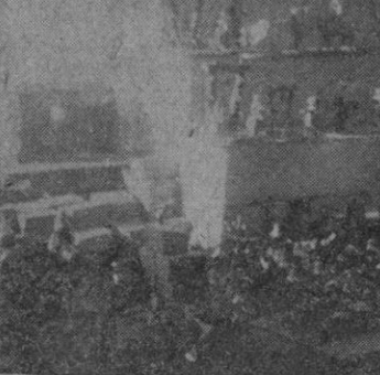
PASTORCILLOS PARA LOS BELENES!

«Precisan» a la N.A.T.O. fuerzas militares en mayor número pero... no pudiéndoselas dar, se hará cuando menos que tengan las que hay una mayor eficacia y potencialidad de los ejércitos soviéticos