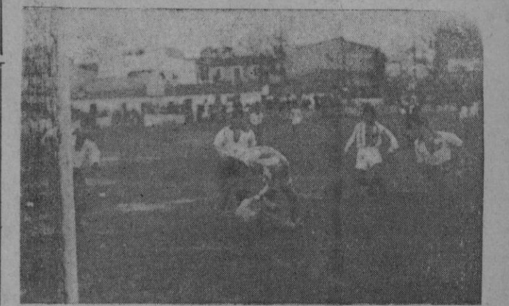
ESTA FOTO NO ES DE LISBOA: ES UN GRAVE MOMENTO FRENTE A LA META DEL ALCOYANO EN SON CANALS

gentinas los portugueses oponen un juego sucio, abusando en las zancadillas que el árbitro no sanciona. Los dos muestran cierto malhumor ante la superioridad técnica de sus contrarios. En una ocasión, el árbitro se acerca a la meta para ayudar a Barriaga a levantarse y éste le aleja airado empujándole con el