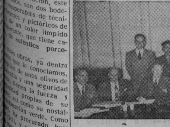
EL EQUIPO AMERICANO EN LA ONU

Por esos mundos El futuro Secretario de Asuntos Exteriores en el futuro gabinete del general Eisenhower, Foster Dulles, ha manifestado que ha pedido ya al Jefe del F.B.I., Edgard Hoover, le facilite sus mejores hombres para realizar