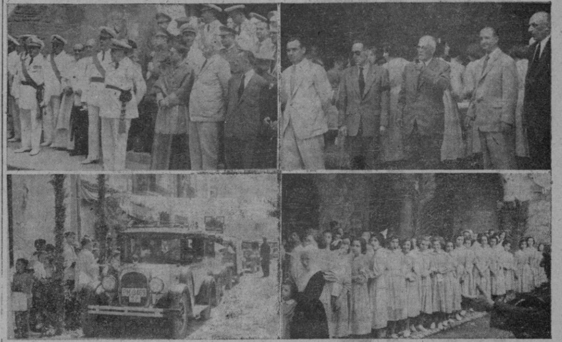
A la izquierda nuestras primeras autoridades a la salida de la Misa en Nuestra Señora de la Merced, y a la derecha el Presidente y elementos directivos de la Cooperativa Taxista. En la parte inferior, respectivamente, bendición de vehículos en Santa Fe y las niñas de los establecimientos benéficos que fueron obsequiados en aquel local Social Taxista.