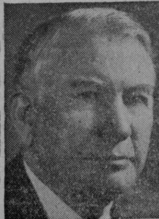
Actual Vice-Presidente de los Estados Unidos de América

La lucha sobre los delegados discutidos pasará ahora al pleno de la convención. La actuación efectiva de la comisión de credenciales ha terminado con la votación de la delegación de Tejas. Este último conflicto y el referente a Georgia se trasladan ahora al pleno para que se adopte una decisión que pue-