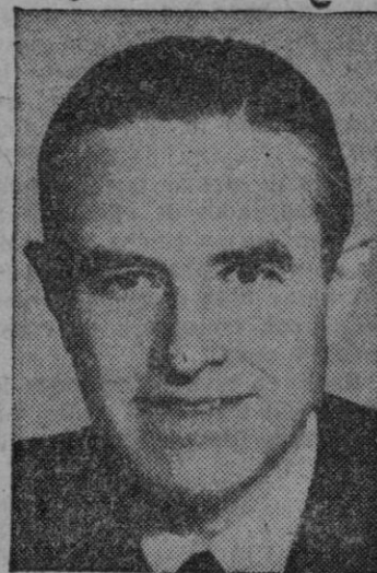
W. AVERELL HARRIMAN Director de la Administración de Seguridad Mutua de los Estados Unidos, aspirante también a candidato por el Partido Democrata a la Presidencia

El arzobispo Amleto Giovanni Cicognani, Delegado Apostólico en los Estados Unidos, durante la firma de un tratado de binestar con las Naciones Unidas en favor de los refugiados y por el cual asegura a estos últimos una gran variedad de derechos nominales.