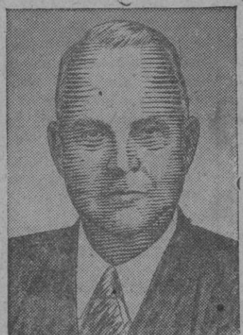
RICHARD B. RUSSELL Senador por el Estado de Georgia que toma parte en la lucha para candidato presidencial por el Partido Demócrata