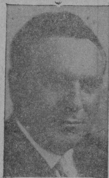
ROBERT S. KERR Senador por el Estado de Oklahoma, otro posible candidato a la Presidencia de Estados Unidos de América. Perteneció al Partido Demócrata