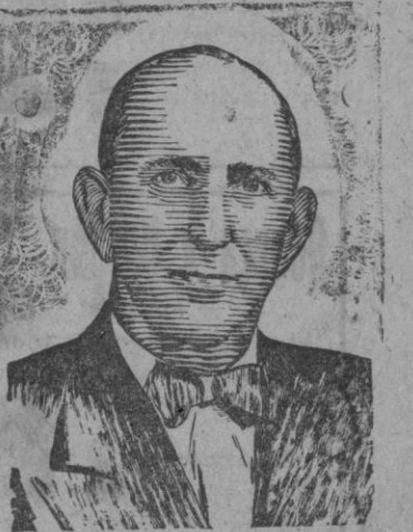
Senador por el Estado de Georgia que toma parte en la lucha para candidato presidencial por el Partido Demócrata