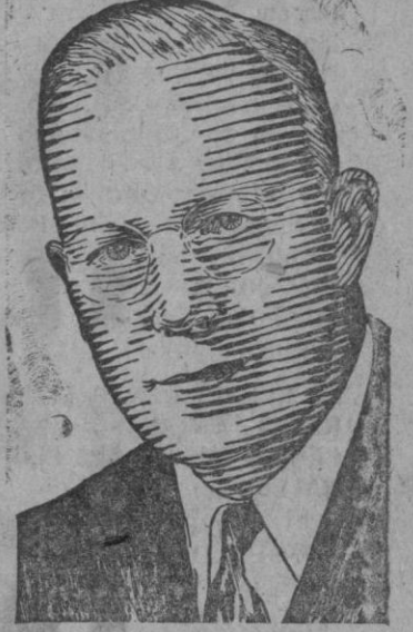
EARL WARREN Gobernador del Estado de California, considerado como un posible candidato a la Presidencia por el Partido Republicano