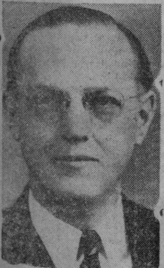
MR. WALTER H. JUDD, DIPUTADO POR EL ESTADO DE MINNESOTA EN LA CAMARA DE REPRESENTANTES NORTEAMERICANA