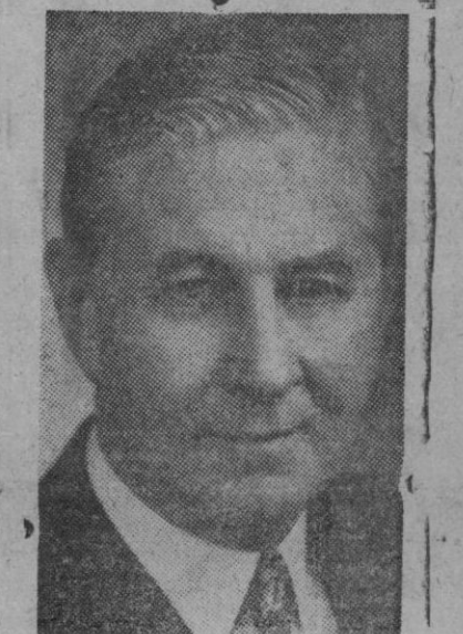
MR. JAMES E. MURRAY, SENADOR NORTEAMERICANO POR EL ESTADO DE MONTANA, EE UU.