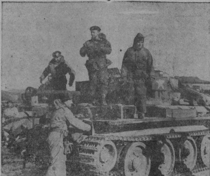
FUERZAS DE UNA UNIDAD ACORAZADA BRITANICA QUE LUCHAN EN COREA, REVISAN CUIDADOSAMENTE SUS TANQUES ANTES DE ENTRAR EN ACCION CONTRA LOS COMUNISTAS CHINOS Y NORCOREANOS