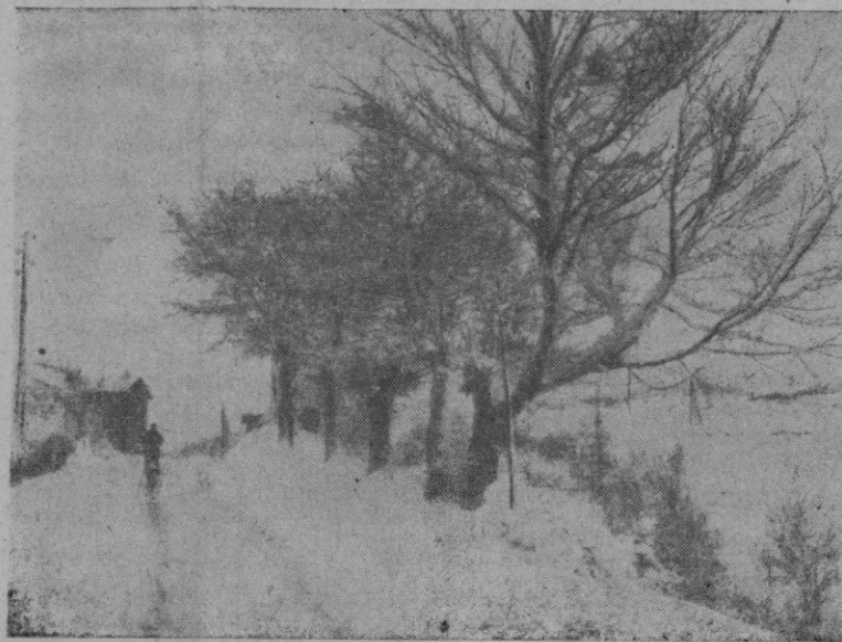
Alto del puerto de E chegarate, en invierno

Pero demos un vistazo a esos puertos y montañas nevadas rápidamente, y no citando todos sino algunos, por aquello de... PARA MUESTRA... BASTA UN BOTON. Allí en tierras de Galicia y Zamoranas tenemos un puerto que una Oreña con Zamora, el de la Guinda y por el que se pasa con dificultad; más adelante, recordamos aquel otro paso, aquel otro puerto en tierras de León, cual es el del Manzanal, donde por él es obligado el cruce por la ruta de Madrid a La Coruña, sobre la cuenca minera de Torre y más adelante en la misma ruta y pasado el antiguo poblado de Ponferrada con su Castillo que perteneció a los Caballeros Templarios, y la Comarca del Bierzo y en la lejanía las Hurdas leonesas, con esos monumentos admirables de estilo mudéjar como Santo Tomás de Las Ollas, Peñalba de Santia-