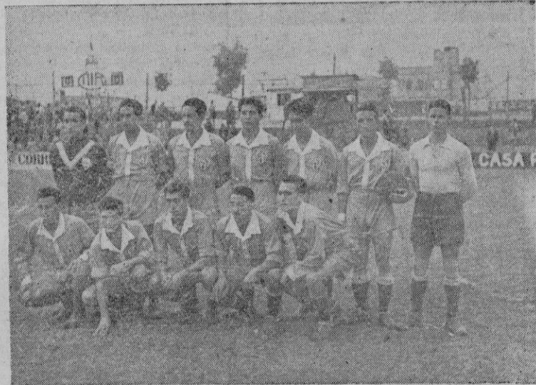
El equipo del San Javier que jugó ayer en Son Canals

Ocho minutos después un corner muy bien sacado por Pueyo, es rematado por Alvarez de cabeza; devuelve, flojo, el defensa derecho visitante y Alor-