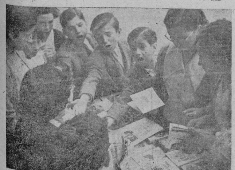
Los niños de las Escuelas que postularon en favor de las misiones.