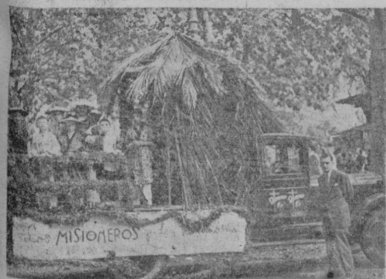
Una de las carreras que desfilaron por nuestras calles en el día del Domingo.