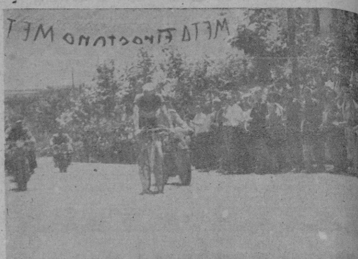
Trobat cruza la meta en la carrera del desmontable