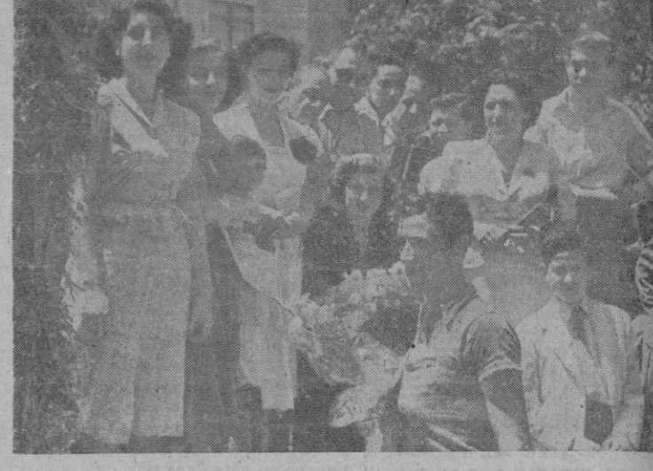
Entrega de premios a los vencedores