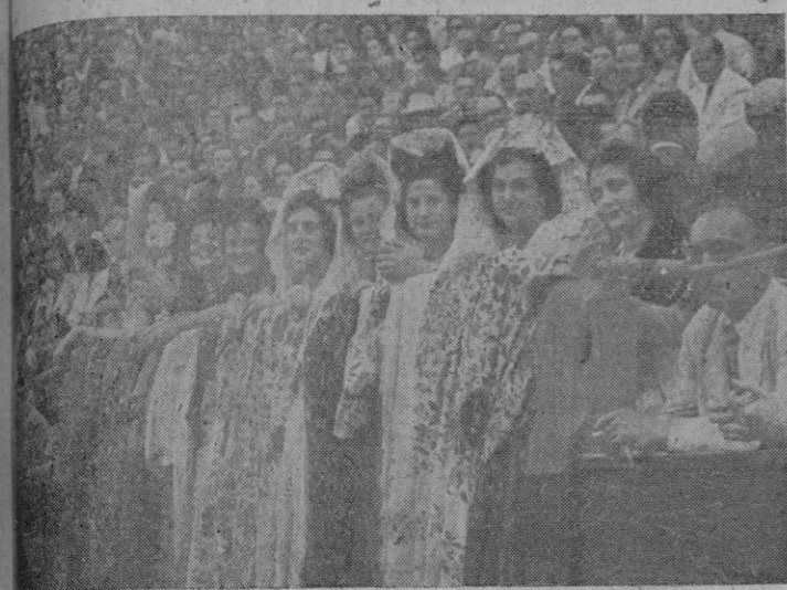
La presidencia de honor en la corrida de ayer.