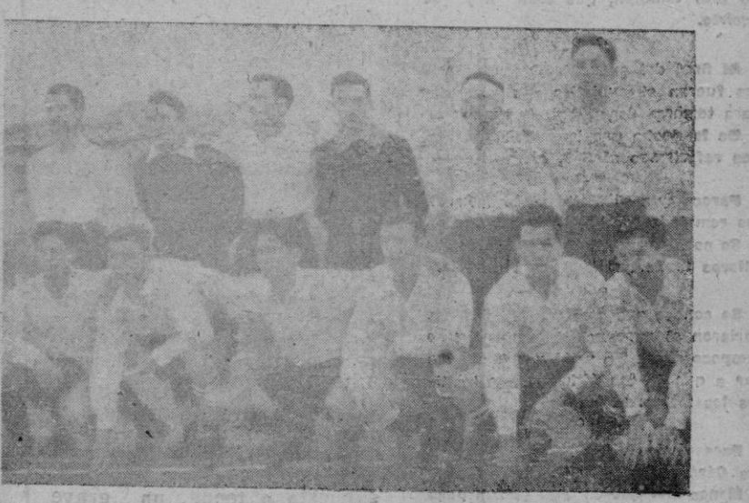
El equipo del San Juan