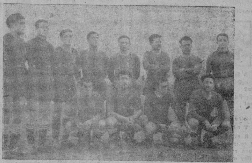
El equipo del Poblense, vencedor en el partido del sábado