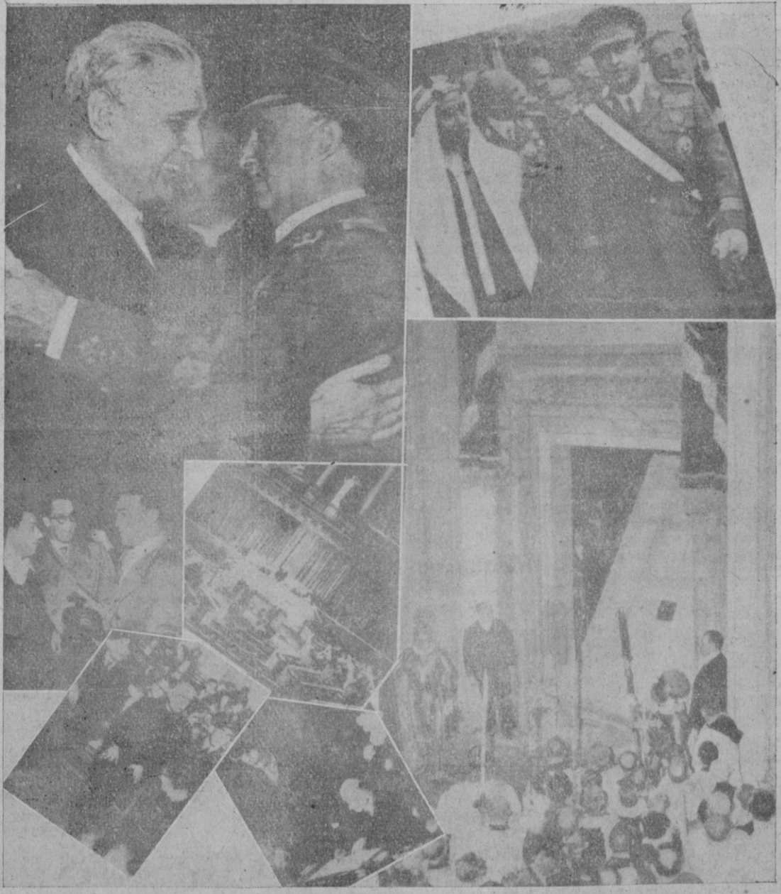
Algunos de los acontecimientos destacados durante el año 1949. Aparecen arriba dos aspectos de la vida española en relación con el extranjero: la visita del Generalísimo Franco a Lisboa, y la del Rey Abdullah de Jordania a nuestro país. Recogemos después la curiosa fotografía de Marcel Cerdan y Ginette Neveu al emprender el viaje aéreo que les costó la vida, figurando también en sus manos el valiosísimo "stradivariu" que en el desaparecido también; al lado, la constitución en Bonn del nuevo Estado Occidental alemán y al pie el Cardenal Mindszenty ante sus "jueces" y la firma del Pacto del Atlántico. Completa nuestro grabado la "Puerta Santa" de la Basílica Vaticana en los momentos de ser abierta como inicio del Año Santo.

Y esta es la base de la crisis según nuestro modo de ver, sin que por ello dejemos de recordar que ciertas gabelas e impuestos, amén de otras exigencias, colocan al negocio en difícil situación, aparte de que no se presta a cuestión tan importante la atención y el apoyo debido.