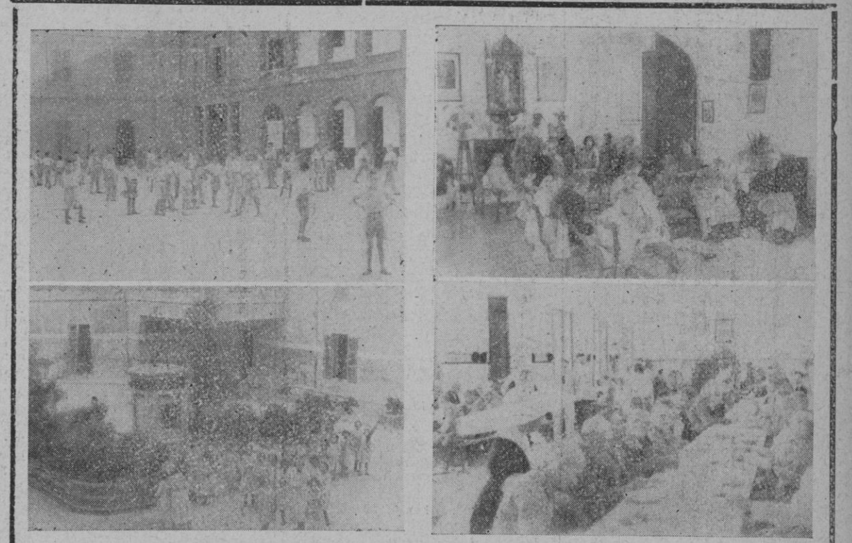
Los niños y niñas acogidos, en los amplios patios de la Casa Misericordia, dedicados al recreo y a los juegos propios de su edad

carpintería, herrería, zapatería e imprenta elegido por el propio interesado y previo, naturalmente, un examen de aptitud. A partir de su ingreso en el taller, reciben de la Diputación una gratificación de una peseta el primer año, que se aumenta el doble en el segundo, al triple en el tercero y así sucesivamente. Cuando se hallan en la edad de afrontar por sí solos los embates de la vida se les busca colocación y, a muchos de ellos el lo desean, se les procura el ingreso en el ejército como voluntarios.