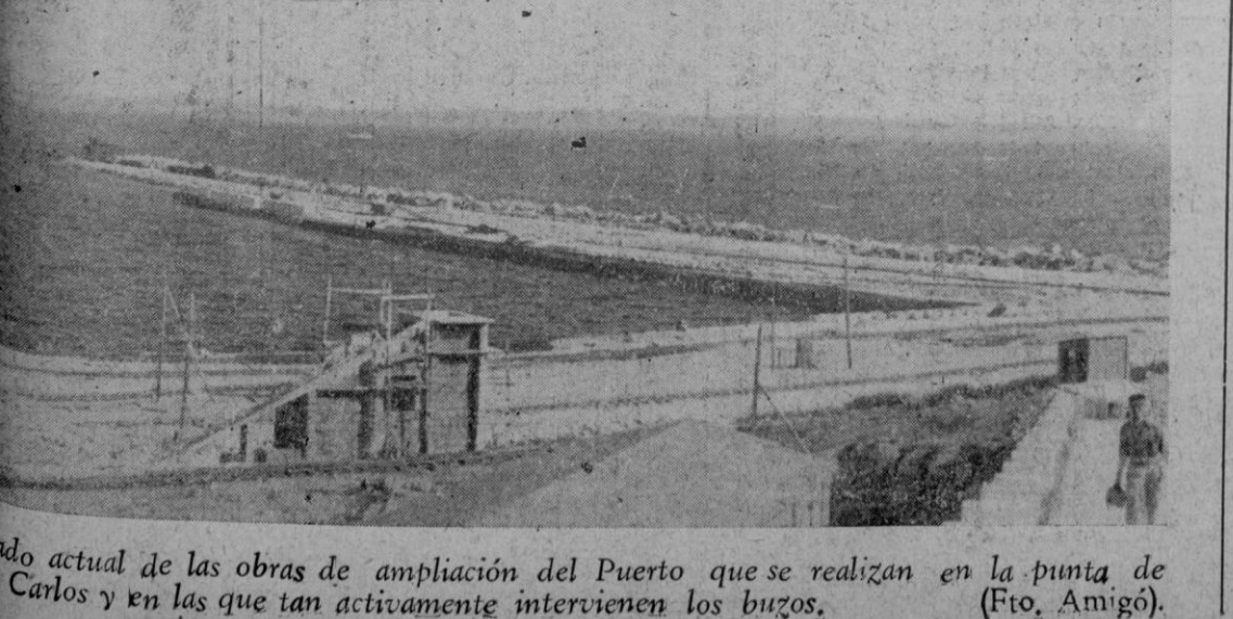
Estado actual de las obras de ampliación del Puerto que se realizan en la punta de Carlos y en las que tan activamente intervienen los buzos.