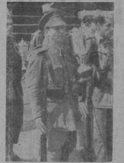
El Sargento jefe de la patrulla del Regimiento de la Cruzada XXVII, Campeón por grupos