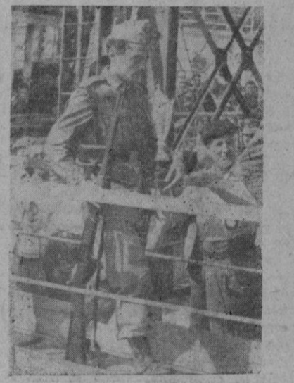
Campeón individual del Tiro de Fusil