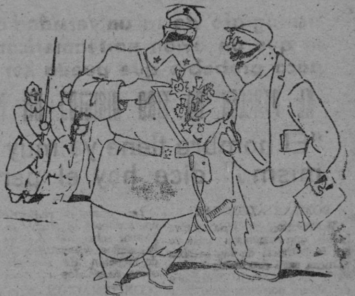
—Y esta otra gran cruz la ganó en la victoria contra el gobierno polaco en Londres. Por «Eseme».