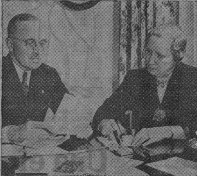
EL PRESIDENTE TRUMAN Y SU ESPOSA. — El Presidente Truman aparece en esta fotografía trabajando en su casa con su esposa.

que perjudiquen a cualquier otro país. De este conflicto han surgido estados naturalmente poderosos, totalmente adiestrados y equipados para la guerra, pero no tienen derecho a dominar al mundo. Hay un momento para hacer planes y otro momento de actuar es ahora.