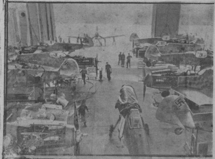
Aspecto de la nave central en que los aparatos de caza están tan preparados para darles los últimos toques.

Información telegráfica de esta tarde en las páginas 7 y 8