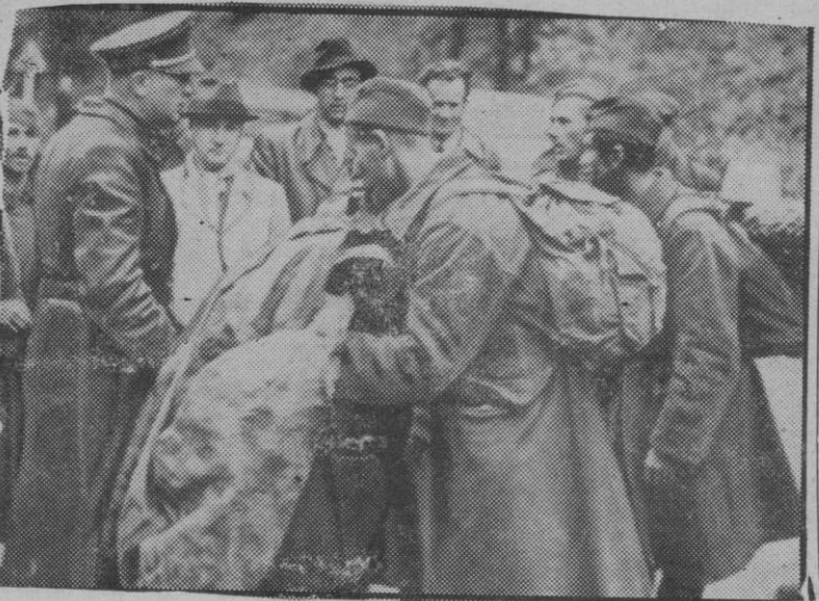
Las tropas alemanas han conseguido rechazar a los comunistas que intentaron apoderarse del territorio eslovaco. En la fotografía vemos un grupo de soldados que fueron encuadrados forzadamente en las filas soviéticas, parados a las líneas alemanas.