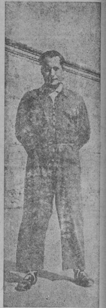
tonio fué inscrito con el número 22.459, fosa 5, fila 9.ª, cuartel 12.

En el folio 76 del libro 4.º del Registro del cementerio José An-