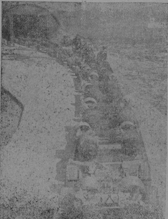
De esta manera, por medio de ferrocarriles especiales, las bombas son conducidas en Inglaterra a cada campo de aviación.