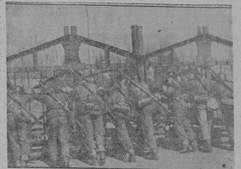
EL CIERRE DE UNA CARRETERA EN LA COSTA DEL CANAL.—Un grupo de soldados alemanes colocando una gigantesca puerta para cerrar el paso de una carretera en la Costa del Canal. Las minas se encargan de cumplir esta misión en los lugares próximos a ella.