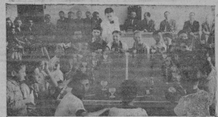
Un bello aspecto de la festiva celebración del domingo en la Casa Provincial de Misericordia