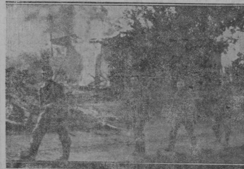
RETIRADA ORDENADA.—Alrededor de los acontecimientos en el Este se ha venido continuamente hablando. Este documento gráfico muestra al último grupo de soldados alemanes que abandonan un poblado después de su total destrucción.

Al final se rezó un Padrenuestro, y el coronel Martí dió los gritos de ritual.