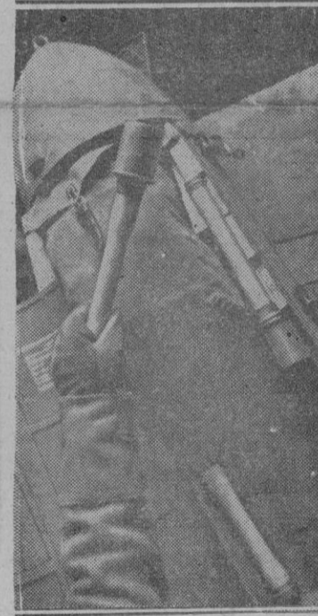
LAS DEFENSAS DE LAS COSTAS DE ITALIA

ha dado al Mundo». Puso de relieve la necesidad de defender la civilización occidental ce los atques bolcheviques.—Efe.