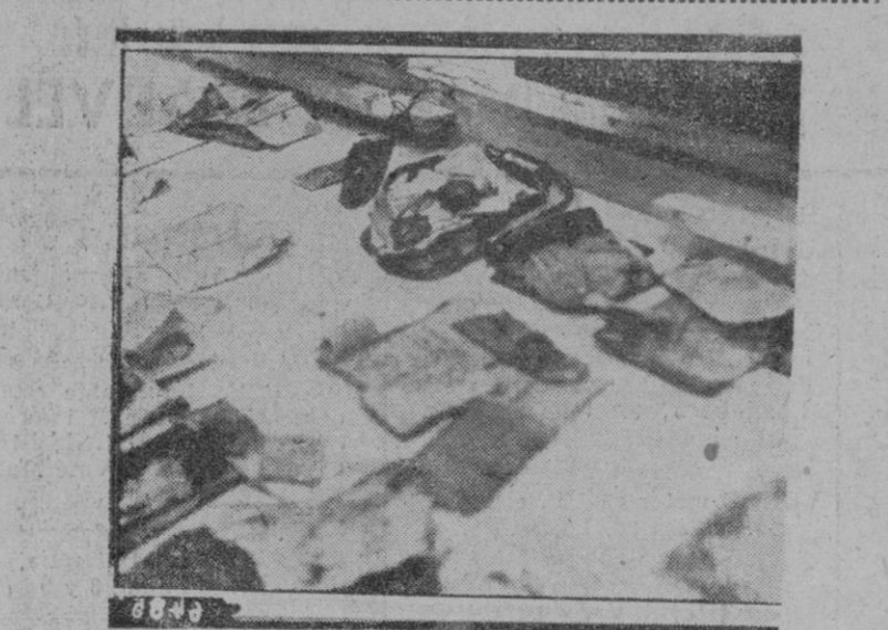
DOCUMENTOS Y OBJETOS DE LOS OFICIALES POLACOS ASESINADOS EN KATYN. — Un detalle de cómo se conservan para ser examinados todos los objetos y documentos que pueden ser recogidos de los cadáveres de oficiales polacos asesinados

Londres. — La radio Argel anuncia que Giraud y Degaulle han decidido el envío de un representante común a Washington para tratar las cuestiones que afectan a los prisioneros de guerra franceses.