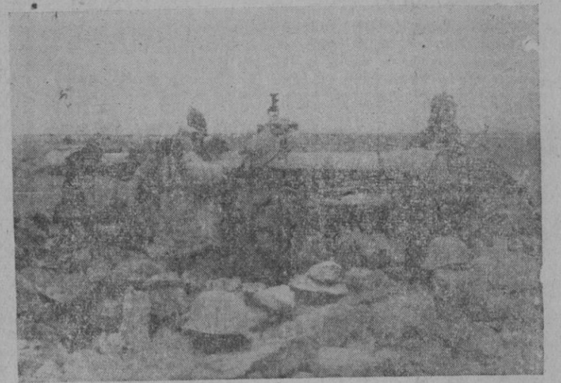
ANTIAEREO PESADO ALEMÁN EN EL DESIERTO LIBICO.— Los observadores constantemente miran el horizonte o el cielo con los gemelos de campaña, en busca de posibles enemigos: tanques o aviones