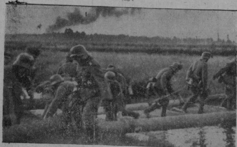
Pontoneros alemanes construyeron un paso sobre un arroyo ruso.

Fruto esplendoroso de nuestra guerra ha sido esta especialísima dedicación a nuestras juventudes, que el Estado y la Falange cuidan con atención incansable, con el anhelo de un constante mejoramiento que redundará al cabo en un beneficio ingente para la pública salubridad. Y es obra a la que no cabe regatear el aplauso más sincero y el más entusiasta apoyo.